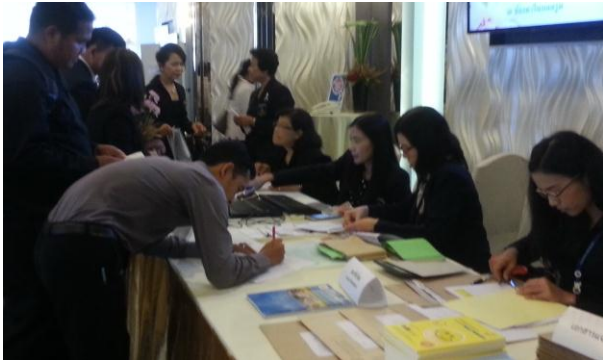
ลงทะเบียนเข้าร่วมประชุม