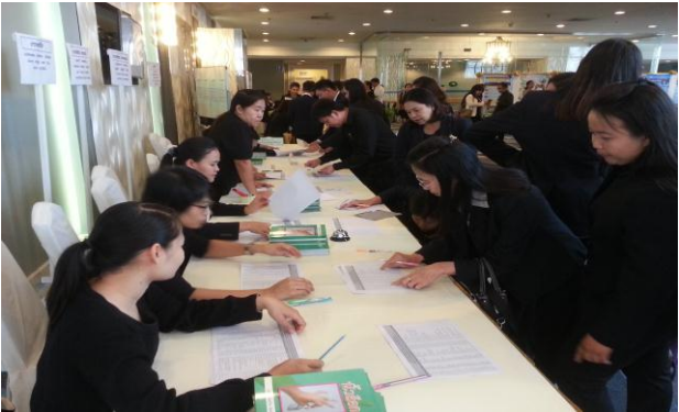
ลงทะเบียนเข้าร่วมประชุม