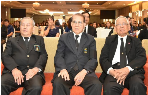
บรรยากาศของการประชุม