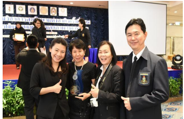
บรรยากาศของการแสดงความยินดี