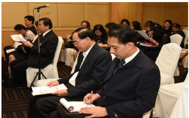
การประชุมสมาชิกสมาคมวิชาชีพสุศึกษา