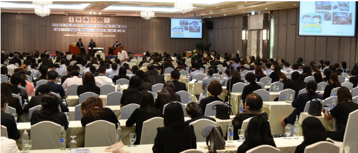
บรรยากาศการอภิปรายทางวิชาการ