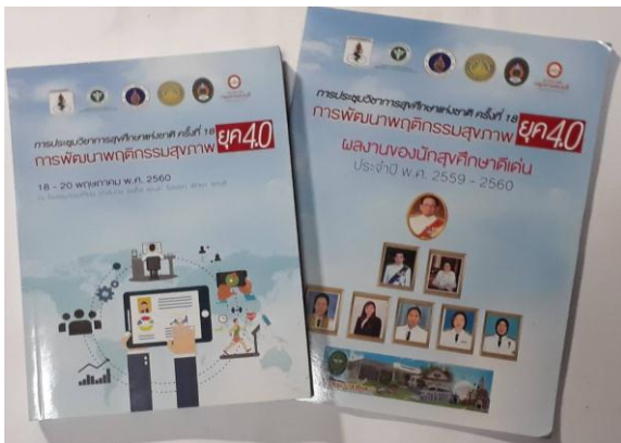
เอกสารประกอบการประชุม