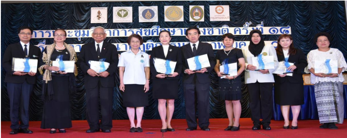
นักศึกษาคณะทันต (ประเภทบุคคลและหน่วยงาน)